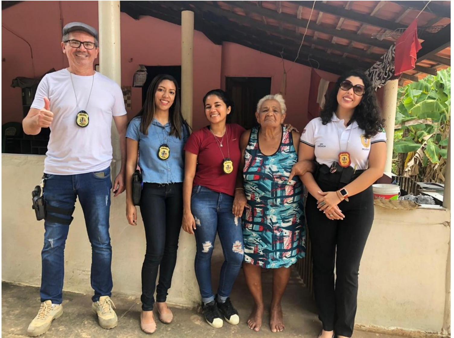
Equipe da Delegacia da Mulher de Barra do Corda

Durante o carnaval, a Delegacia da Mulher também vai entregar um abadá com o slogan 'brota na DP' e distribuir copos com dicas de segurança relacionadas a violência de gênero. O objetivo é, no fim do Carnaval, obter uma redução no número de crimes na cidade.