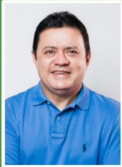
Foto para urna