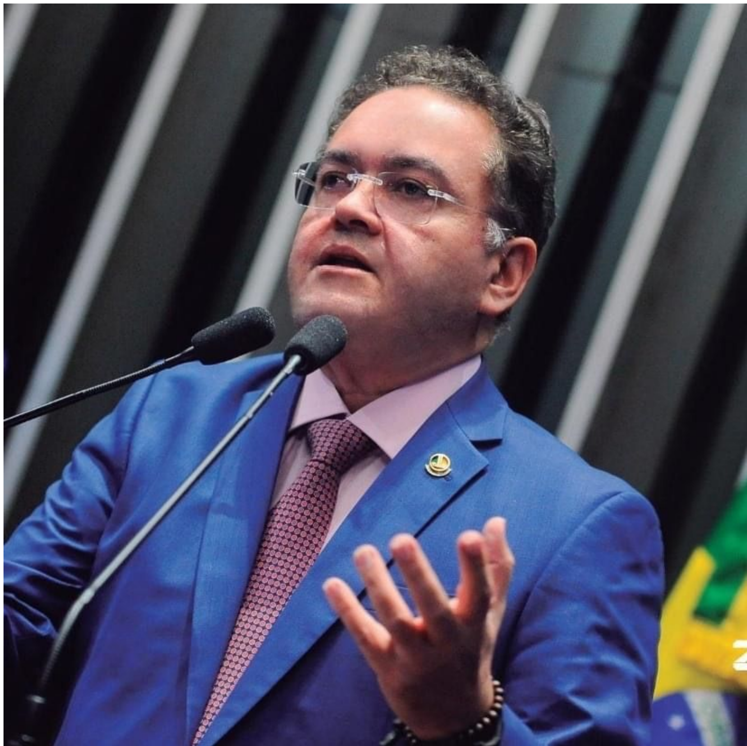
EFEITO DO LOCKDOWN EM SÃO LUÍS