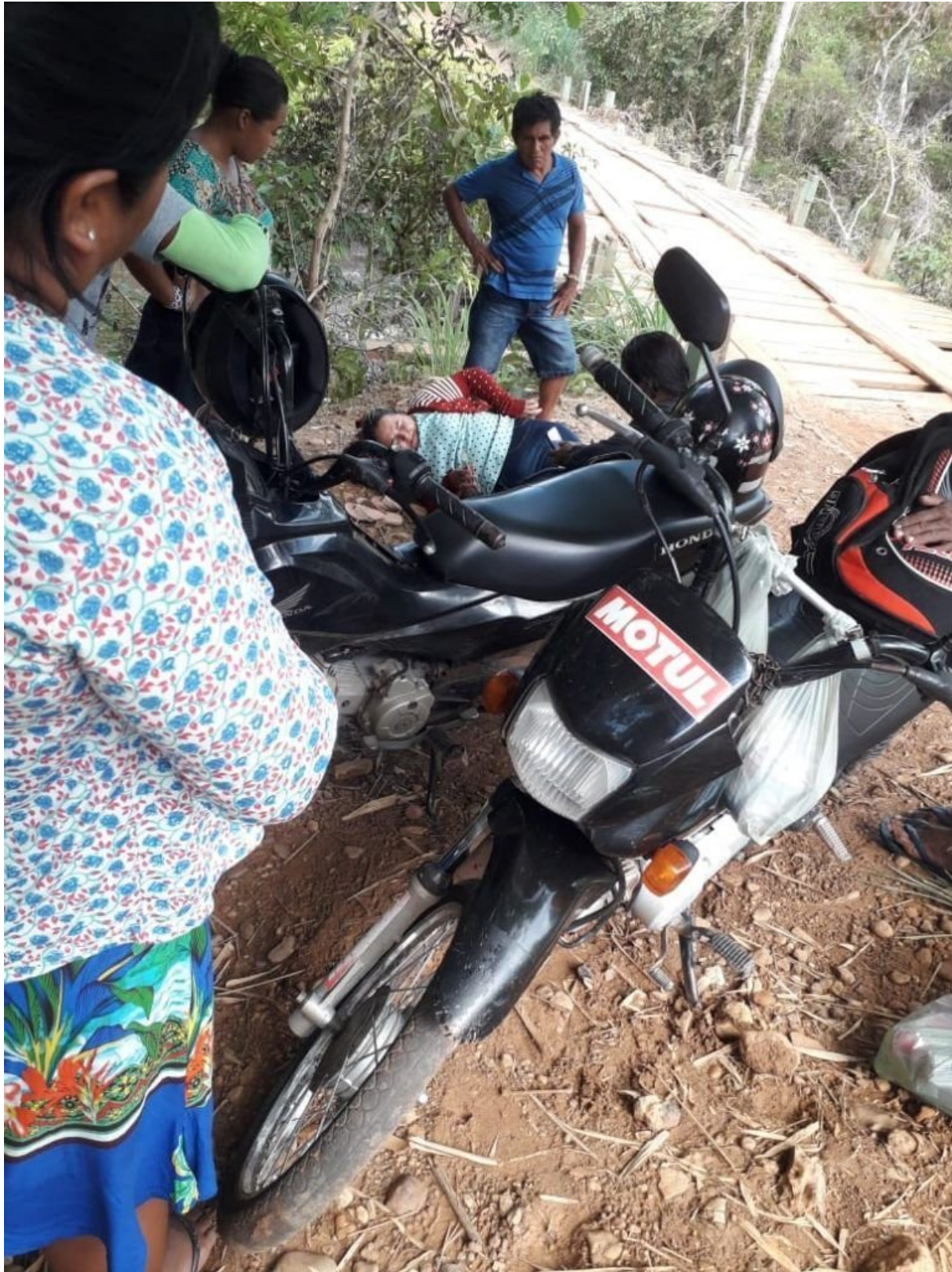
Em sua moto, a