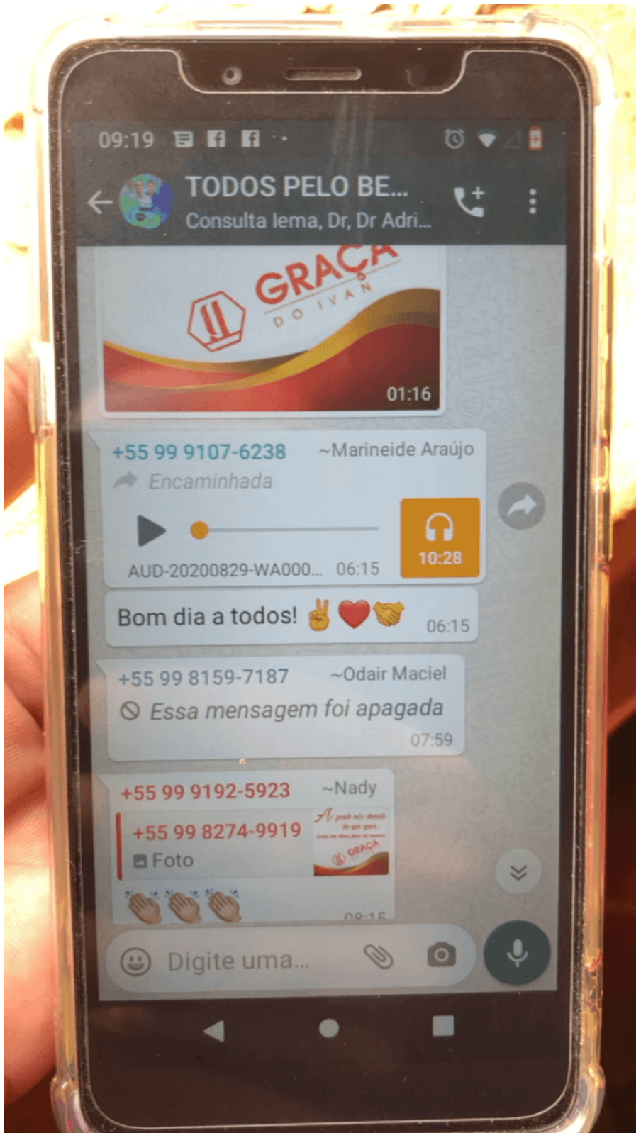
O texto falso publicado usou ainda